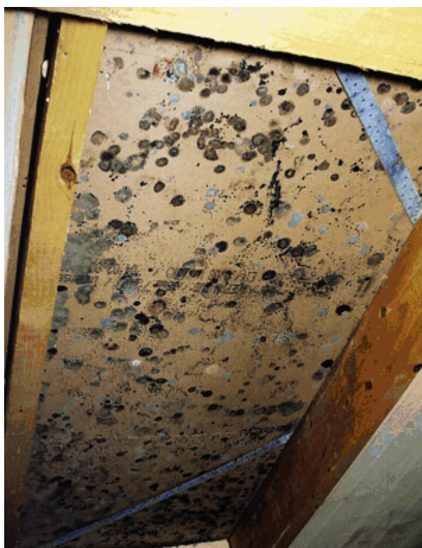
Bild 3: Stark befallene Holzfaserplatte hinter einer Wärmedämmung ohne Dampfsperre.

Typische Befindlichkeitsstörungen durch Pilzgifte sind Grippegefühl, Muskelschmerzen und chronische Erschöpfungszustände. Da häufig zunächst nur ein unklarer Zusammenhang mit dem Aufenthalt in bestimmten Räumen gesehen wird, spricht man hier, wie auch bei gesundheitlichen Beeinträchtigungen durch Ausdünstungen aus Möbeln oder Baustoffen, von einem "Sick Building Syndrom".