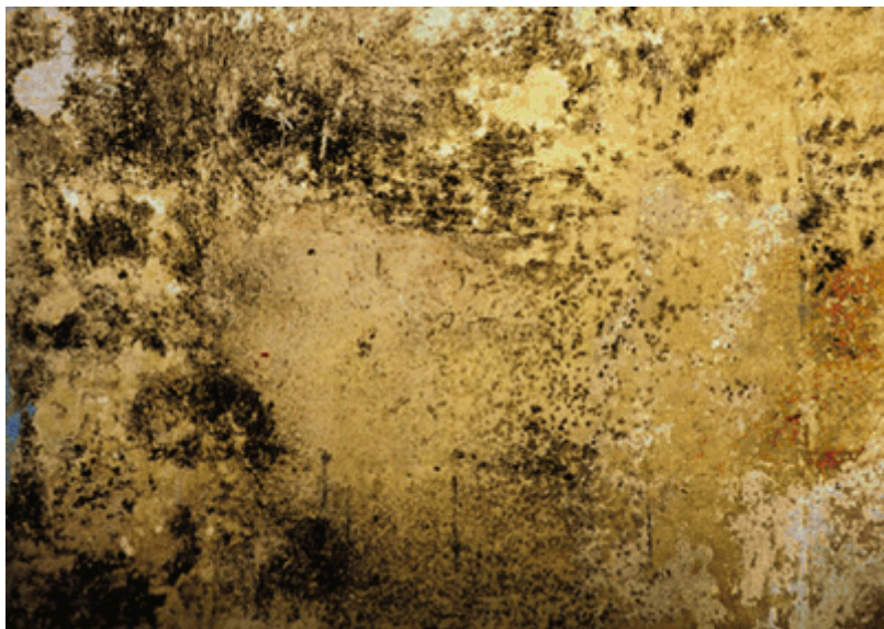
Bild 6: Großflächiger Befall nach Lösch- und Regenwassereinbruch.